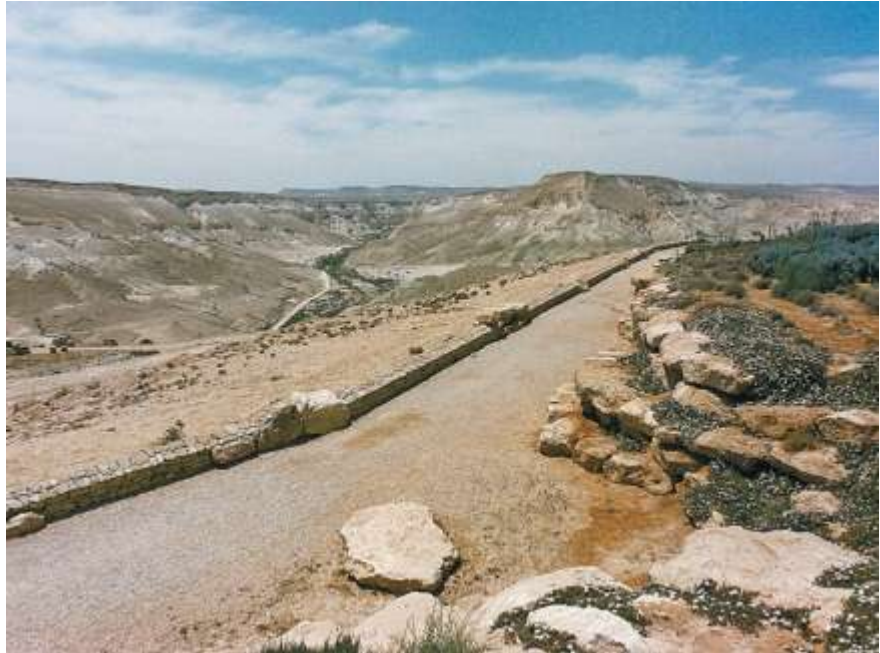
הטיילת ההיקפית באחוזת קבר בן גוריון. צילום: דן צור, מתוך הספר "תבנית נוף"

בלהט העשייה ויצר השינוי ובריאת עולם חדש ואדם חדש שאחזו בבני דורם בכל תחום, יהלום וצור לא רק כיסו את "מה שקיים" במרבדי גנים, בדשא ובעצים אלא גם עקרו הרים והזיזו סלעים, הסיטו נחלים ממסלולם ופיסלו תוואי קרקע, כדי ליצור תבנית נוף מלאכותית בטבעיות גמורה ומבלי שהמאמץ העל-אנושי כמעט יורגש. בחורשת טל, לדוגמה, הם היטו את מימי נחל דן, הקימו מפלי מים שאלוהים לא ברא וחפרו אגם מלאכותי טבעי. את הבריכה הטבעית של הסחנה, שהיתה מוקפת בנוף טבעי של קוצים ושיחי פטל מאובקים, הם הפכו ל"גן השלושה" המוריק, גן עדן מעשה ידי אדם.