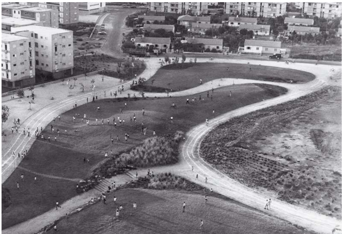
פארק צה"ל בקיראון, מראה משנות ה 60