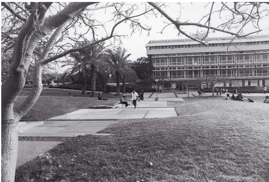
הרחבה המרכזית באוניברסיטת תל אביב