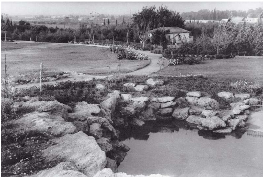
גן העצמאות בפתח תקוה, מראה משנות ה-50