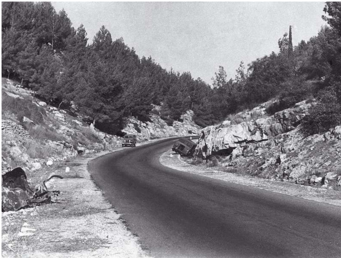
דרך השיירות בשער הגיא בימי הקמתה, 1949