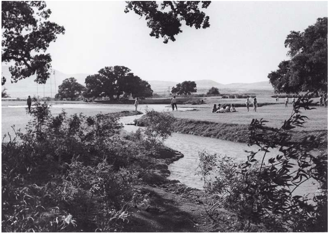
חורשת טל, מראה משנות ה 60