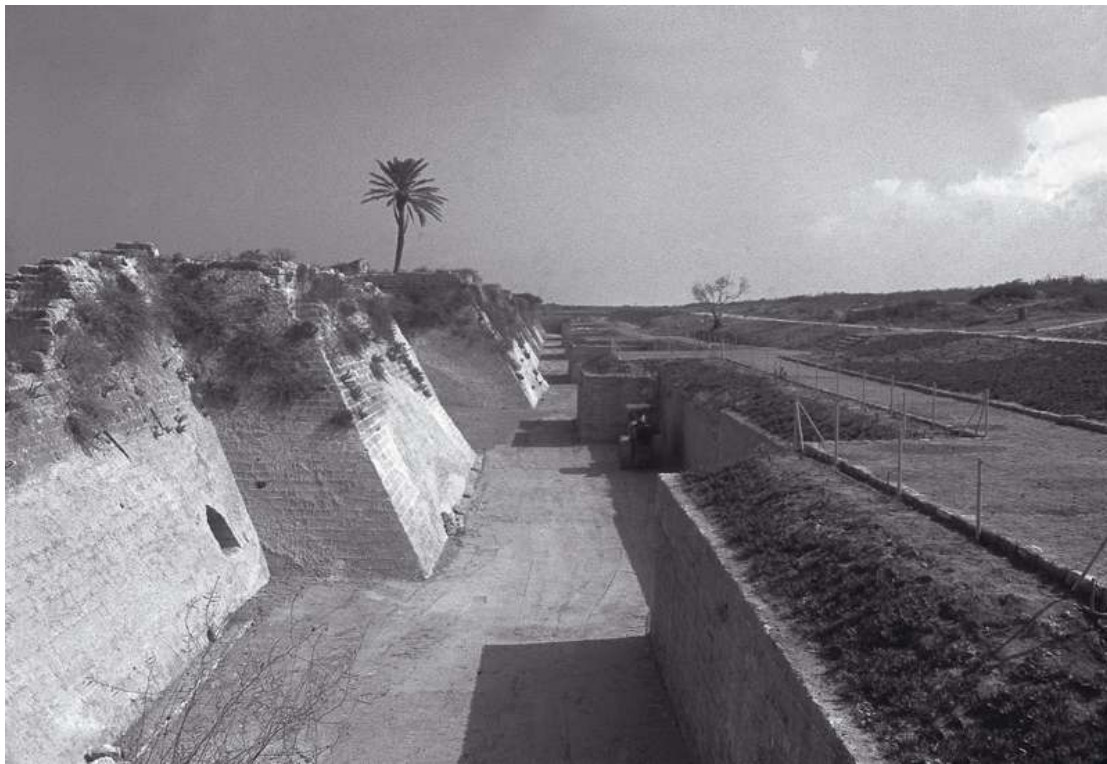
קיסריה, טיילת החפיר הצלבני.