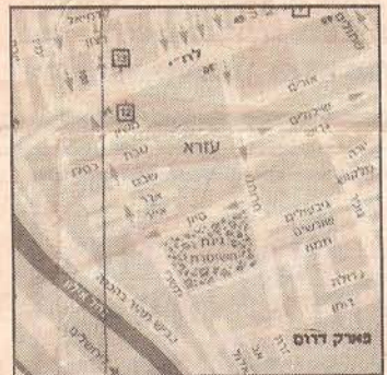
ישר מהאוטוסטרדה. שכונת עזרא

עיריית תל אביב. היום ממררים לאנשי השכונה הזאת את החיים, עד כדי כך שלא מתירים להם להחליף גג מתמוטט. לפי התר כנית ויכולו התושבים לנצל את הקרקע השייכת להם, סוף סוף, לבניה, גם כאן עד כמה שיותר על בסיס המרקם הקיים. בסוף התהליך יתוספו לשכונה 300 יחידות דיור, בבתים צמודי קרקע ללא עמודים, וכן מוסדות ציבור ושט חים ירוקים. אחת הבעיות שהתוכנית מתכוונת לפתור היא הבעלות המור כבת על הקרקע (ארמת מושה). כבר נפתרה בעיית האוטוסטרדה שהיתה אמורה, לפי מיטב המסורת של שנות השישים, לחסל את השכונה. הסתבר פשוט שלא צריך אותה. השכונה שר כנת על פארק דרום, ממש גולשת לתוכו, ובחלומות אפשר להשוות, לפחות את המיקום, לרחובות הגולשים לתוך פארקים במקומות אחרים בעולם.